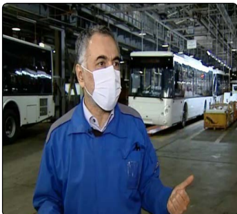
مطالب، سوزها و نظرات خود را برای ما ارسال کنید

به گزارش تین نیوز، سعید لیلانز در مصاحبه اختصاصی با خبرنگار خبرگزاری صدا و سیما افزود: هم‌اکنون اتوبوس‌های تولیدی خود را به شهرداری‌های تهران و کرمان تحویل داده ایم همچنین در حال تحویل به شهرداری مشهد هستیم ضمن اینکه با ۱۰ شهرداری نیز برای تولید و تحویل اتوبوس مذاکراتی در حال انجام داریم.