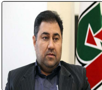
شماره پانصد و نود و دوم - نسخه آزمایشی - ۱۳ دی ماه ۱۳۹۹