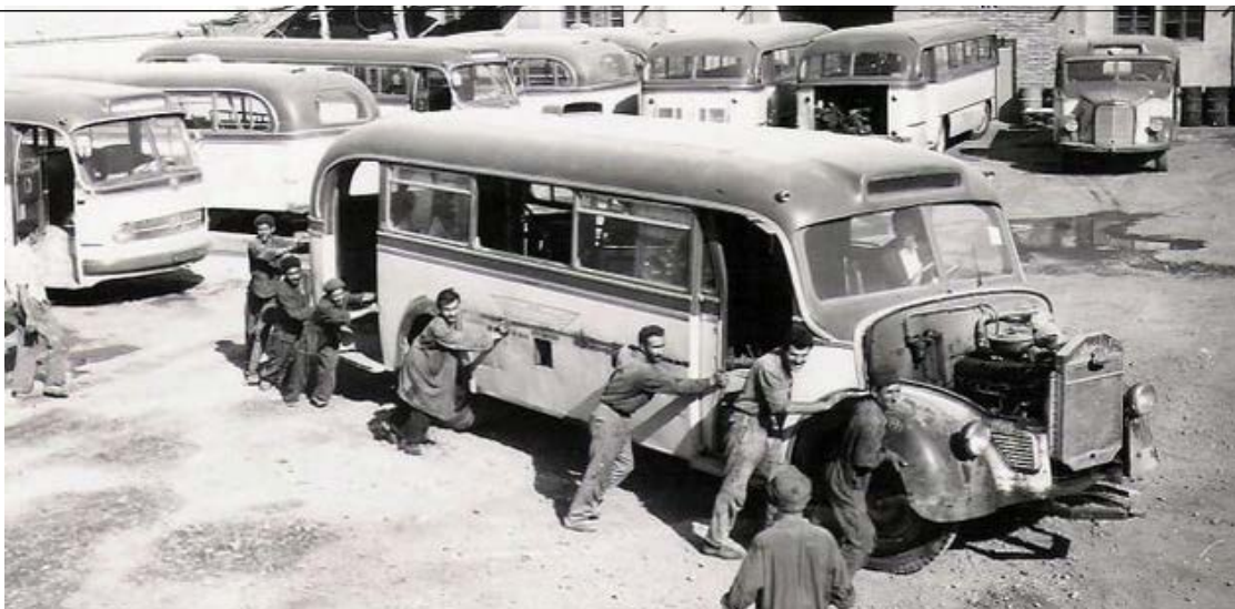
بنیانگذار خطوط اتوبوسرانی تهران کسی نبود جز مهدی قلی‌خان هدایت معروف به مخبر السلطنه، سیاستمدار و ادیب عصر قاجار و پهلوی که در دوران حکومت شش پادشاه ایران رضا و محمدرضا پهلوی و احمد، محمدعلی، مظفرالدین و ناصرالدین شاه قاجار زندگی کرد و ۵۳ سال از عمر خود را در دربار پنج پادشاه ایران رضا و محمدرضا پهلوی و احمد، محمدعلی، مظفرالدین و ناصرالدین شاه قاجار خدمت کرد.