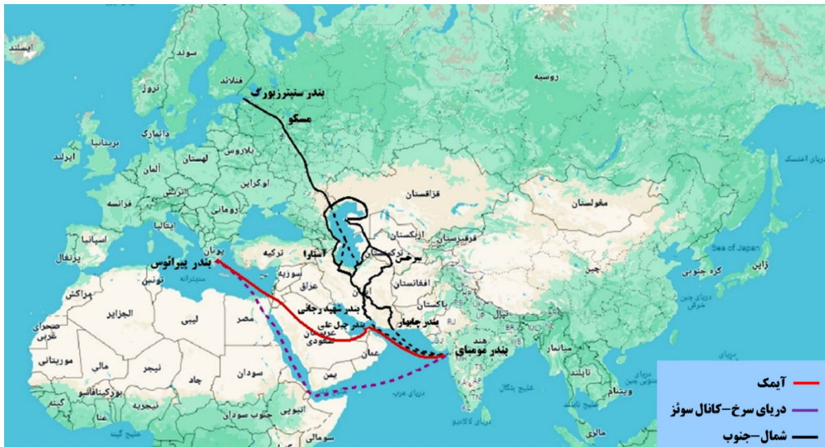
شکل ۱. مسیرهای اتصال هند به اروپا

گزینه قدیمی تر حمل و نقل چندشیوه‌ای هند به اروپا، کریدور شمال-جنوب عبوری از ایران است که یک شبکه از مسیرهای جاده‌ای، ریلی و دریایی، مقرون به صرفه از نظر زمان سفر و هزینه، برای اتصال هند تا اروپای شمالی و غربی است [۳]. ایده ایجاد این کریدور حمل و نقلی اولین بار توسط هند، روسیه و جمهوری اسلامی ایران با امضای توافق نامه بین‌دولتی، در ۱۲ سپتامبر ۲۰۰۰ به منظور تقویت تجارت و ارتباطات حمل و نقل بین کشورهای در مسیر خود اتخاذ شد [۳]. سپس در سال ۲۰۰۲ سه کشور، قراردادهای مقدماتی برای توسعه کریدور حمل و نقل بین‌المللی شمال-جنوب به طول ۷۲۰۰ کیلومتر را امضا کردند، در طی سالهای اخیر، این قرارداد به تصویب ۱۳ کشور رسیده است [۴]. مسیر اصلی این کریدور از هلسینکی فنلاند شروع شده و از روسیه تا دریای خزر ادامه می‌یابد و در آنجا به سه شاخه تقسیم می‌شود: شاخه غربی از طریق آذربایجان یا ارمنستان به غرب ایران، شاخه مرکزی از طریق دریای خزر به ایران و شاخه شرقی از طریق قزاقستان، ازبکستان و ترکمنستان به شرق ایران می‌رسد. بر این اساس، مسیرها در تهران پایتخت ایران به هم می‌رسند و تا بندر عباس ادامه می‌یابند و سپس از طریق دریا به بندر غربی هند خواهند رسید [۵]. با در نظر گرفتن اهمیت ژئواستراتژیک و اقتصادی همه کشورهای درگیر در کریدور شمال-جنوب، این کریدور ظرفیت ارتقای ارتباط هند با آسیای مرکزی و منطقه اوراسیا و برعکس را نیز دارد [۳].