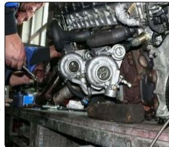
شماره پانصد و بیست و یکم - نسخه آزمایشی - ۲۴ شهریور ماه ۱۳۹۹

نخستین موتور ملی دوگانه‌سوز لکوموتیو با حضور مدیرعامل راه آهن جمهوری اسلامی ایران در شرکت دیزل سنگین ایران (دسا) در شهرک صنعتی امل آزمایش شد. این موتور که تا یک ماه دیگر از آن استفاده خواهد شد، با سرمایه گذاری ۴۰ میلیارد ریالی و صرفه جویی ۷۰ درصدی در مصرف گاز طراحی و ساخته شده است. تست این موتور با حضور مدیرعامل شرکت راه آهن انجام شد. سعید رسولی در آیین رونمایی از نخستین موتور ملی دوگانه‌سوز لکوموتیو در شرکت دیزل سنگین ایران اظهار