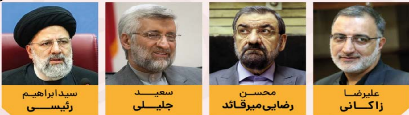
سید ابراهیم رئیسی

معاون امور بندری و اقتصادی سازمان بنادر و دریانوردی از هدف‌گذاری افزایش ۵ هزار میلیارد ریالی سرمایه‌گذاری بخش غیردولتی در بنادر خبر داد. فرهاد منتصر کوهساری درباره اهداف توسعه‌ای که برای بنادر کشور و جذب سرمایه گذاران بخش خصوصی در نظر گرفته شده است، اظهار داشت: امروزه بنادر به عنوان دروازه‌های اصلی ورود و خروج کالا به کشورها محسوب می‌شوند و عملکرد مناسب و کارایی بالای آنها می‌تواند در شکوفایی تولید و اقتصاد آن کشور نقش بسیار تعیین کننده‌ای ایفا کند.