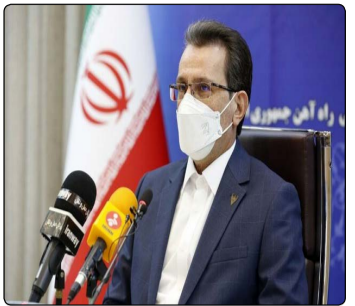
شماره ششمصد و هفتاد و نهم - نسخه آزمایشی - ۴ خرداد ماه ۱۴۰۰

سعید رسولی، معاون وزیر راه و شهرسازی و مدیرعامل شرکت راه‌آهن جمهوری اسلامی ایران، در گفت‌وگو با خبرنگار پایگاه خبری وزارت راه و شهرسازی با اشاره به سفر خود به جمهوری ارمنستان که در قالب هیات همراه وزیر راه و شهرسازی انجام شد، گفت: با توجه به اتفاقات اخیر که در منطقه به وقوع پیوست