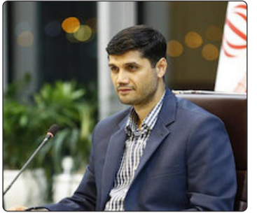
شماره هفتصد و هشتاد و سوم - نسخه آزمایشی - ۹ آذرماه ۱۴۰۰

مدیرعامل شرکت راه آهن گفت: مشکلاتی که طی سالهای گذشته بویژه در حوزه تعمیرات و نگهداری لکوموتیو و زیرساخت به وجود آمده، به هیچ عنوان قابل دفاع نیست. سید میعاد صالحی به لزوم آماده باش ناوگان ریلی سراسر کشور جهت خدمات رسانی مطلوب در حوزه بار و مسافر جهت زمستان امسال اشاره نموده و بر ضرورت برنامه ریزی راه آهن جمهوری اسلامی ایران برای عید نوروز ۱۴۰۱ تاکید کرد.