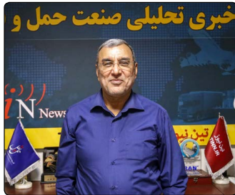
خبری تحلیلی صنعت حمل و

اخیراً وزیر راه و شهرسازی در راستای کاهش پروازهای چارتری عنوان کرده بود که هزینه ایرلاین متأثر از نوسانات ارزی افزایش یافته است از همین رو قصد داریم برای شرکت‌های هواپیمایی، سرمایه در گردش جذب کنیم تا مسائل مالی خود را حل کنند تا نخواهند بلیت‌ها را به آژانس‌ها به‌صورت چارتری پیش‌فروش کنند. نماینده اسبق ایران در ایکائو در این رابطه به خبرنگار سرویس هوایی تین نیوز می‌گوید: یکی از دلایل بسیار مهمی که ایرلاین‌ها به سمت چارتر می‌روند