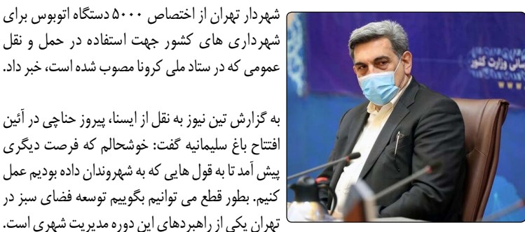
شماره پانصد و هشتاد- نسخه آزمایشی-۲۴ آذر ماه ۱۳۹۹

شهردار تهران از اختصاص ۵۰۰۰ دستگاه اتوبوس برای شهرداری های کشور جهت استفاده در حمل و نقل عمومی که در ستاد ملی کرونا مصوب شده است، خبر داد. به گزارش تین نیوز به نقل از ایسنا، پیروز خناچی در آئین افتتاح باغ سلیمانیه گفت: خوشحالم که فرصت دیگری پیش آمد تا به قول هایی که به شهروندان داده بودیم عمل کنیم. بطور قطع می توانیم بگوئیم توسعه فضای سبز در تهران یکی از راهبردهای این دوره مدیریت شهری است.