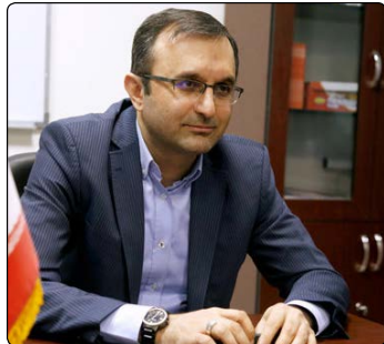
مطالب، سوزها و نظرات خود را برای ما ارسال کنید