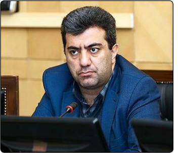
شماره سیصد و هجدهم - نسخه آزمایشی - ۱۳ مهر ماه ۱۳۹۸