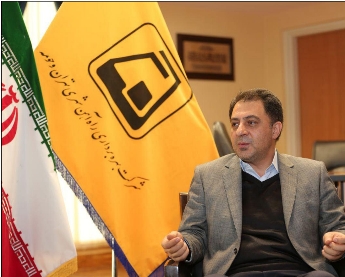
مدیرعامل شرکت بهره برداری متروی تهران و حومه خبر داد: