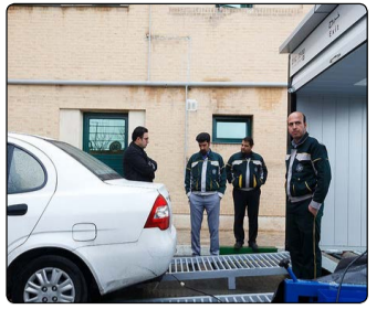
شماره صد و پنجاه و نهم - نسخه آزمایشی - ۱۰ بهمن ماه ۱۳۹۷