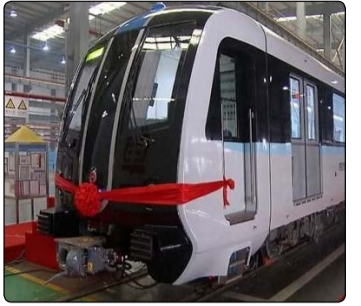
شماره سیصد و پنجاه و هشتم - نسخه آزمایشی - ۱۱ آذر ماه ۱۳۹۸

مجموعه‌ای از شرکت‌های دانش‌بنیان شامل تام لوکوموتیو آریا، مدیریت انرژی نوآور افق (مانا)، جهاد دانشگاهی، فن ژنراتور و چندین شرکت دیگر با همکاری یکدیگر اقدام به طراحی و ساخت سیستم رانش به عنوان قلب محرک واگن مترو کردند. این کنسرسیوم توانسته است با تکیه به دانش و توان داخلی قسمت‌های مختلف سیستم رانش را طراحی کند. با توجه به رشد و افزایش تراکم جمعیت در کلان شهرها به خصوص شهر تهران، تقاضا برای سفرهای درون شهری هر روز افزایش می‌یابد.