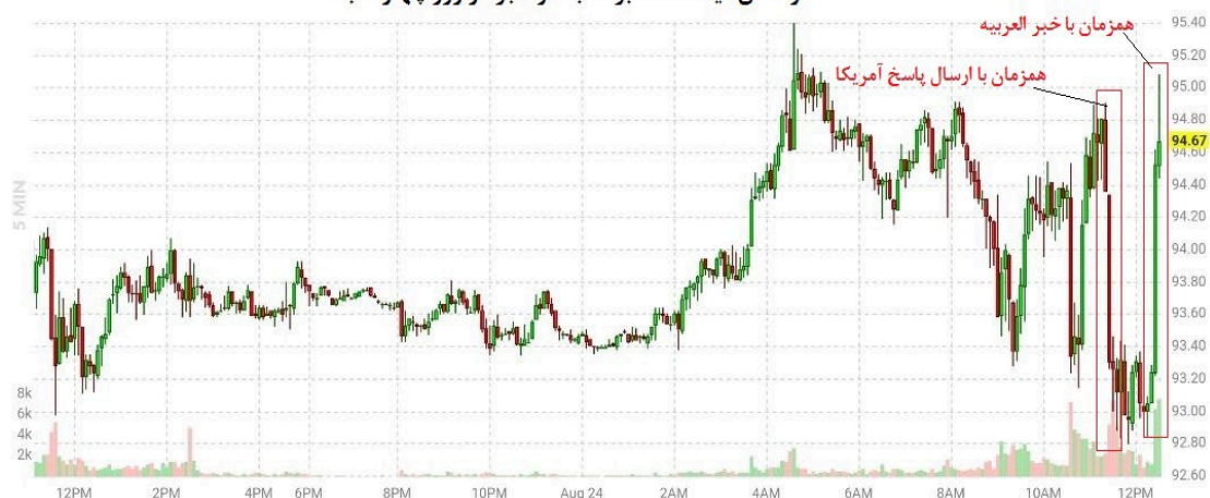
نمودار ۱. قیمت نفت برنت همزمان با اعلام دو خبر

در این میان اکثر رسانه‌ها متفق‌القول بر فروش ۵۰ میلیون بشکه نفت ایران در ۱۲۰ روز ابتدایی پس از حصول توافق بعنوان یکی از بندهای توافق جدید تاکید کرده‌اند. همچنین پایگاه خبری بلومبرگ در گزارشی نوشت، احیای توافق هسته‌ای می‌تواند منجر به افزایش صادرات نفتی ایران و جبران کمبودها در بازار جهانی شود. بر اساس این گزارش، ۹۶ میلیون بشکه نفت ذخیره شده ایران، در صورت لغو تحریم‌ها می‌تواند با سرعت زیادی وارد بازار شود. همزمان مدیر نظارت بر تولید نفت و گاز شرکت ملی نفت ایران، از ظرفیت‌سازی برای دستیابی به توان تولید نفت خام به میزان ۴ میلیون و ۳۸ هزار بشکه در روز تا ماه مارس سال ۲۰۲۳ و افزایش توان صادراتی ایران در صورت لغو تحریم‌ها خبر داد. براساس گزارش پایگاه خبری پترولجستیک صادرات نفت خام ایران در یک ماه اخیر افزایش یافته و این خود بنوعی نشانگر تسهیل در فرایند صادرات ایران همزمان با نزدیک شدن به حصول توافق است. در این گزارش آمده است صادرات نفت خام ایران در ۲۱ روز نخست ماه اوت به طور متوسط ۱ میلیون و ۱۳۱ هزار بشکه در روز بوده که در مقایسه با ماه ژوئیه ۳۳۳ هزار بشکه در روز افزایش داشته است (نمودار ۲).