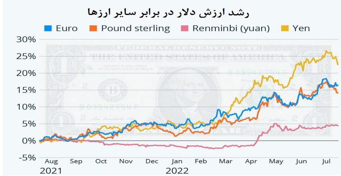
نمودار ۳. ارزش دلار در برابر سایر ارزها در یکسال اخیر (Statista)